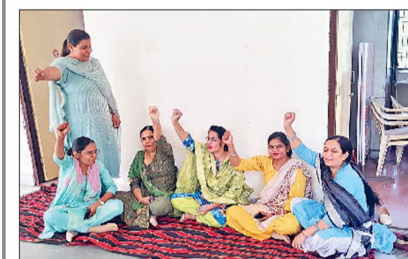
भिवानी। महिला एवं बाल विकास विभाग कार्यालय के बाहर धरने के दौरान नारेबाजी करती सुपरवाइजर और महिला एवं बाल विकास विभाग के अधिकारी को ज्ञापन सौंपती सुपरवाइजर।