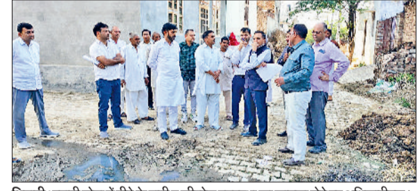
भिवानी। बवानी खेड़ा में पीने के पानी व सीवरेज व्यवस्था का जायजा लेते हुए अधिकारियों।