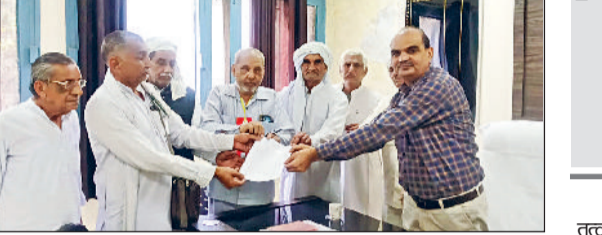
भिवानी। तहसीलदार को ज्ञापन सौंपते संगठन के सदस्य।