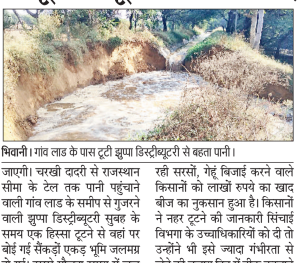
भिवानी। गांव लाड के पास टूटी झुप्पा डिस्ट्रीब्यूटरी से बहता पानी।

मिट्टी की बड़ी मेढ तैयार कर दी। किसानों के रोष की जानकारी मिलने के बाद नहर टूटने की घटना के छह घंटे बाद विभाग के अधिकारियों ने मौके पर पहुंच कर सुध लेते हुए पानी बंद करवाया।