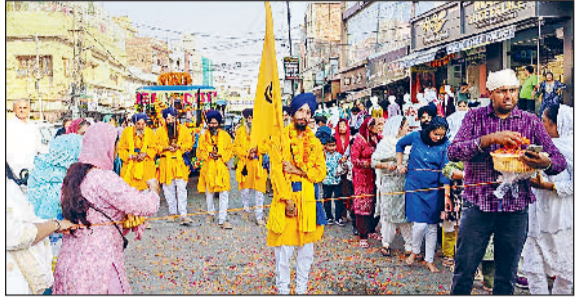
भिवानी। शोभायात्रा में शामिल पंज प्यारे। व शोभायात्रा में करतब दिखाते कलाकार।

पंजाब के मानसा से पहुंचे गतका के माहिर गुरसिक्ख बच्चों ने दिखाए जौहर हरिभूमि न्यूज़ ►► मिवाणी